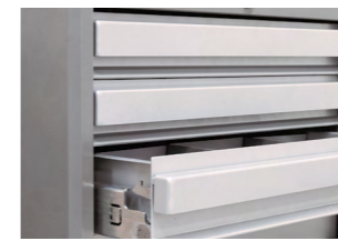
圖 3. 櫃體安全導角設計