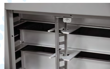
圖 2. 限鎖設計

分段式後方安全勾，使用者需經由按壓安全開關動作帶動櫃體整體動作，預防使用者使用時開一格，卻抽屜一起開的情況，避免使用者有不小心被抽屜撞傷、刮傷、受傷的情形。