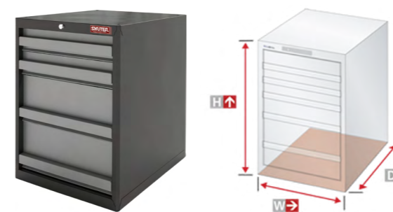
圖 4. 櫃體內部空間加大 HDC-1051 櫃體：H1000*W600*D547